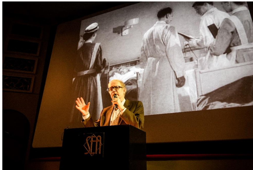
Physicians in movies, Peter von Bagh