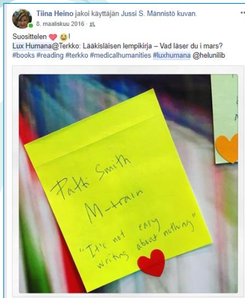
Literary advent calendar