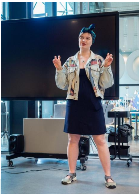
Poetry Slam, "Nihkee Akka"